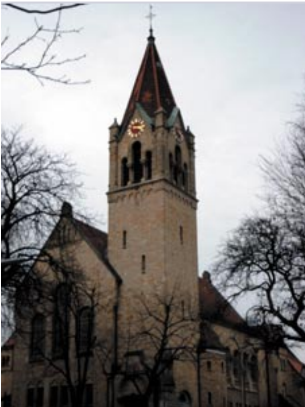
Bergkirche in Osnabrück

Der Grund für diese Praxis ist, dass die römisch-katholischen Kirchen nach Heiligen benannt werden, wobei häufig deren Reliquien im Altar einge-