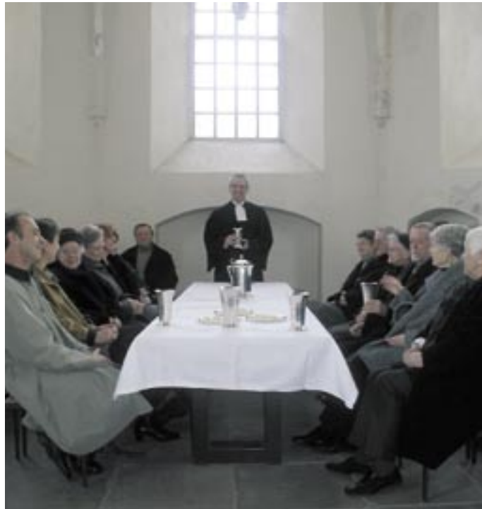
Abendmahlsfeier in Leer-Loga (Ostfriesland)

sondern „Abendmahls-tisch“. In evangelisch-lutherischen Kirchen sieht es oft genauso aus, aber da wird dieser Tisch „Altar“ genannt. Hintergrund ist das unterschiedliche Verständnis des Abendmahls zwischen römisch-katholischer und evangelischer Kir-che in der Reformati-onszeit. Ein Altar ist in vielen Religionen eine Opferstätte, und nach damaligem römisch-ka-tholischem Verständnis