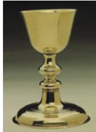
Abendmahlskelch der evangelisch-reformierten Gemeinde Celle

Über mehrere Jahrhunderte hinweg hat diese Trennung zwischen lutherischem und reformiertem Abendmahlsverständnis bestanden. Erst 1973 haben fast alle