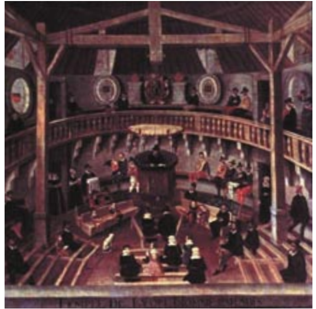
Temple de Paradis in Lyon, erste neugebaute reformierte Kirche von 1564

Die meisten Kirchengebäude der evangelisch-reformierten Gemeinden in Deutschland sind bereits vor der Reformation gebaut worden. Sie waren so gestaltet, dass in ihren zumeist länglichen Innenräumen der Blick auf den vorne stehenden Altar ausgerichtet war. Oft hatten sie auch sogenannte Hochaltäre, die in besonderer Weise Aufmerksamkeit beanspruchten.