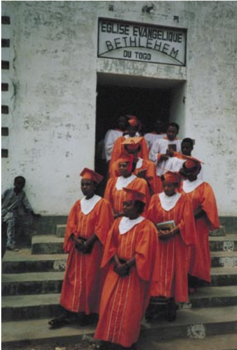
Festlicher Auszug aus einem Gottesdienst der evangelischen Kirche in Togo, einer Partnerkirche der Evangelisch-reformierten Kirche

Neben den Lutheranern und Reformierten, die in Deutschland die größten evangelischen Kirchen sind, gibt es weltweit noch andere zahlenmäßig starke evangelische Kirchen, die in Deutschland eine Minderheit ausmachen, etwa die Baptisten oder die Methodisten.