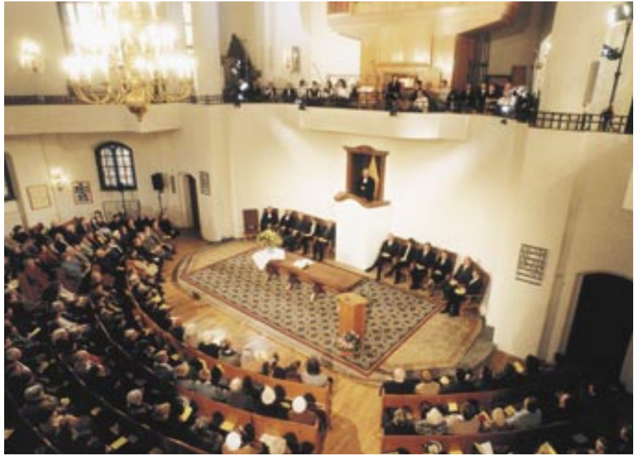
Gottesdienst der evangelisch-reformierten Gemeinde in Leipzig

Soll man die evangelischen Gottesdienste vereinheitlichen? Solche Überlegungen gab es schon