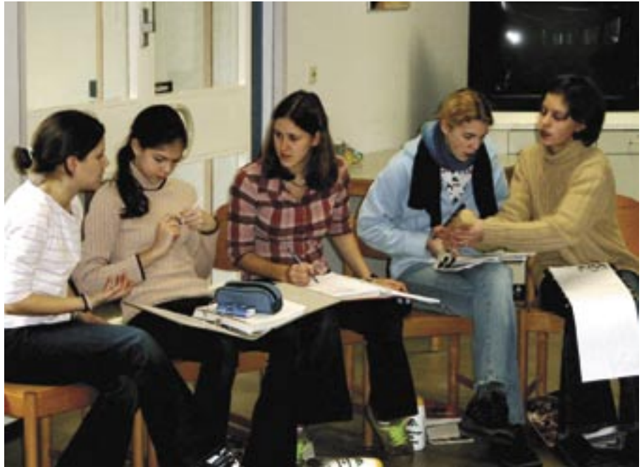
Konfirmanden der evangelisch-reformierten Gemeinde Melle

Pastoren und Pastorinnen sind verantwortlich für die Gottesdienste; hier hat der Kirchenrat/ das Presbyterium keine Kontrollfunktion. Die Aufgabe des Kirchenrats bzw. Presbyteriums ist es, die Arbeit in der Gemeinde zu fördern und zu verantworten sowie alle Mitarbeiter in der Gemeinde zu unterstützen. Darüber hinaus ist es für die Mitglieder im Kirchenrat / Presbyterium wichtig, immer ein Ohr an der Basis der Gemeinde zu haben, um aufkommende Probleme nicht zu groß werden zu lassen und Wünsche erfüllen zu können.