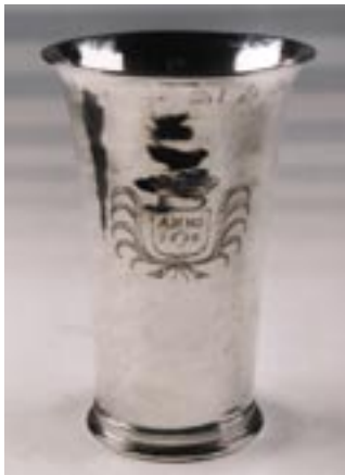
Abendmahlsbecher der evangelisch-reformierten Gemeinde Grootegaste (Ostfriesland)

Zwingli las hier anders. Brot bleibt Brot und Wein bleibt Wein. Aber beides verweist auf das Kreuzesgeschehen, in dem Jesus Christus für das Heil der Welt starb. Calvin hat später betonen können, dass das Abendmahl uns vor Augen führt und schmecken lässt, was uns zugute am Kreuz geschehen ist.