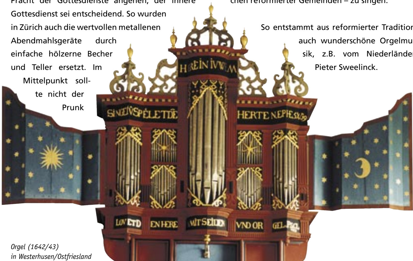
Orgel (1642/43) in Westerhusen/Ostfriesland

So entstammt aus reformierter Tradition auch wunderschöne Orgelmusik, z.B. vom Niederländer Pieter Sweelinck.