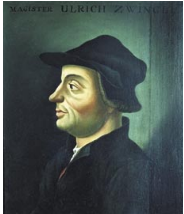
Ulrich Zwingli (1484 - 1531)

Die evangelisch-reformierte Kirche geht zurück auf die Reformation in der heutigen Schweiz, vor allem in Zürich und Genf. In Zürich war es zunächst Ulrich Zwingli (1484 - 1531), der aufgrund von römisch-katholischen Missständen eine Reform der Kirche begann. Seine große reformatorische Entdeckung war, zunächst ganz unabhängig von Luther, die Einzigartigkeit der Autorität der Bibel. Seine Reformation zog in der deutschsprachigen Schweiz große Kreise. Für die weltweite reformierte Bewegung waren dann die Stadt Genf und der Reformator der zweiten Generation, Johannes Calvin (1509 – 1564), wichtig. Seine Bemühungen galten der Ausarbeitung der reformierten Lehre und der Organisation der Kir-