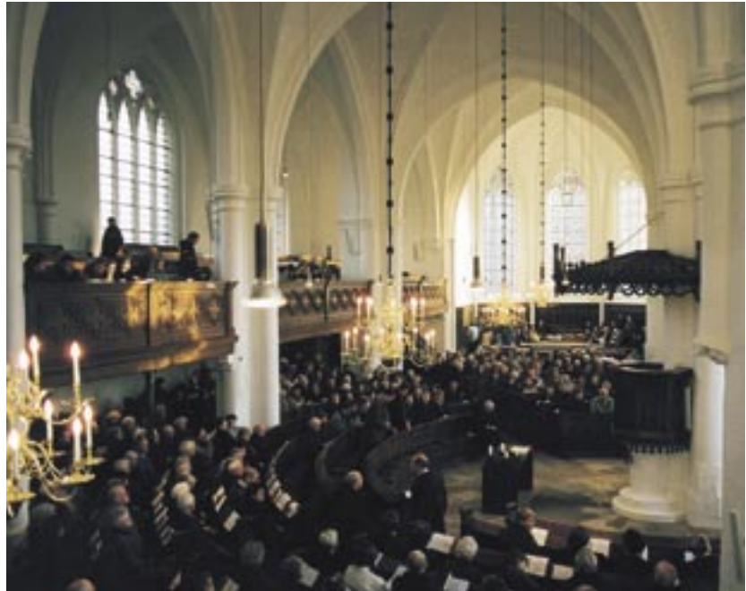
Gottesdiens in Schüttorf (Grafschaft Bentheim)

der deutschen Reformierten, der Heidelberger Katechismus, formuliert, dass die Bilderverehrung deshalb problematisch ist, weil Gott nicht in Bildern gefasst werden kann. Und auf die Frage, ob denn nicht die Bilder die biblischen Geschichten erzählen können für diejenigen, die des Lesens nicht mächtig sind, antwortet der Heidelberger Katechismus: „Nein; denn wir sollen uns nicht für weiser halten als Gott, der seine Christenheit nicht durch stumme Götzen, sondern durch die lebendige Predigt seines Wortes unterwiesen haben will.“ (Frage 98)