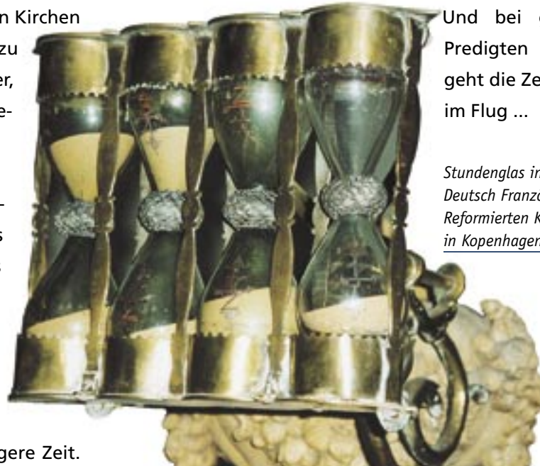
Stundenglas in der Deutsch Französisch Reformierten Kirche in Kopenhagen