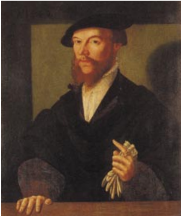
Johannes Calvin (1509 - 1564)

mierte. Aus Frankreich flohen im 16. und 17. Jahrhundert reformierte Christen, die in ihrem Land verfolgt wurden: die Hugenotten. An mehreren Orten Deutschlands wurden sie aufgenommen und gründeten dort Gemeinden. Die Reformierten in Deutschland haben also grob gesagt zwei Entstehungsgründe: Zum einen über den „normalen“ Weg, indem der Landesherr die Konfession vorgab; zum anderen über die Aufnahme von Flüchtlingen.