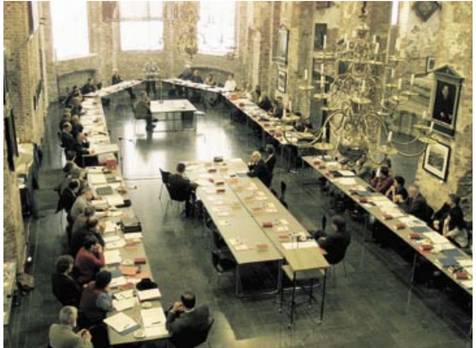
Tagung der Gesamtsynode in der Johannes a Lasco Bibliothek in Emden

bar dem, was in anderen Landeskirchen Kirchenkreis oder Dekanat heißt. Das Wort „Synode“ kommt aus dem Griechischen und heißt: gemeinsamer Weg. Und genau darum geht es in einem Synodalverband. Die Gemeinden fragen zusammen nach dem für sie richtigen Weg. Es gibt Entscheidungen, die für mehrere Gemeinden getroffen werden müssen. Das geschieht auf der Synode, die regelmäßig zusammentritt. Jede Kirchengemeinde wählt Synodale, d. h. Abge-